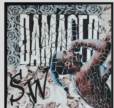
Voorbeelden van leerlingen.